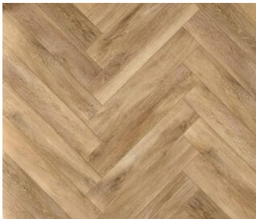
Ułożenie płytek – zdjęcie poglądowe.

Do układania płytek stosować elastyczny, odpowiedni rodzaj kleju oraz spoin, przystosowany do dużych formatów płytek. Krawędzie cokolików od góry wykończyć listwami aluminiowymi pod kolor płytki.