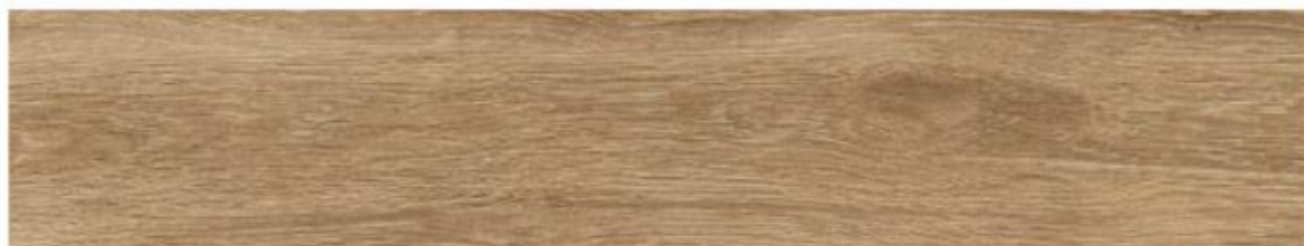
Płytką podłogowa – zdjęcie poglądowe.

-Wykonać nową posadzkę wraz z cokolikiem wys. 10 cm, z płyt typu gres, nieszkliwionych, jako imitacji klepki parkietowej o rysunku i odcieniu ciepłego drewna, o wymiarach ok. 10/60 cm, o min odporności na ścieranie PIE IV, i min. antypoślizgowości R9. Płytki układać w jodełkę.